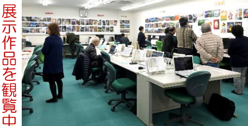
展示作品を観覧中