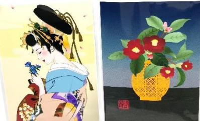
ワードでお絵かき作品