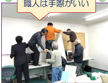
職人は手際がいい