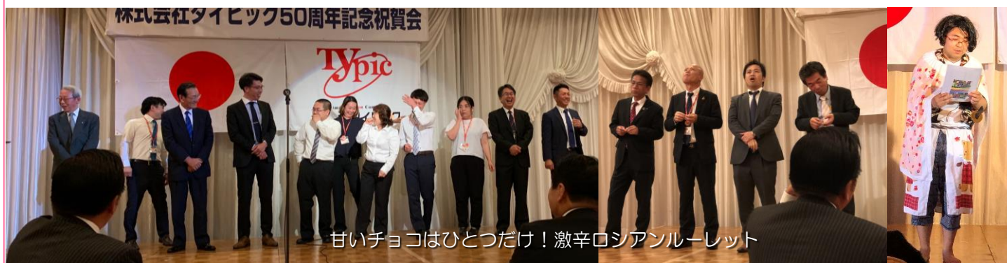
甘いチョコはひとつだけ！激辛ロシアンルーレット