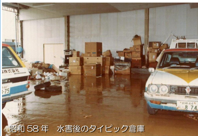
昭和58年 水害後のタイプック倉庫

翌日から復興作業が開始されたが、断水で水が無く社内の土泥除去は大変なものだった。そのうえに多くのお客様の複写機が水に浸かり、引き上げをしなければならず、(株)リコーからも応援部隊が入り、三輪バイクで土泥を被った複写機をお客様から引き上げた。また、水害後、益くらいまでは関連会社や関連会社の社員の自宅、友人宅などの清掃作業に追われた。